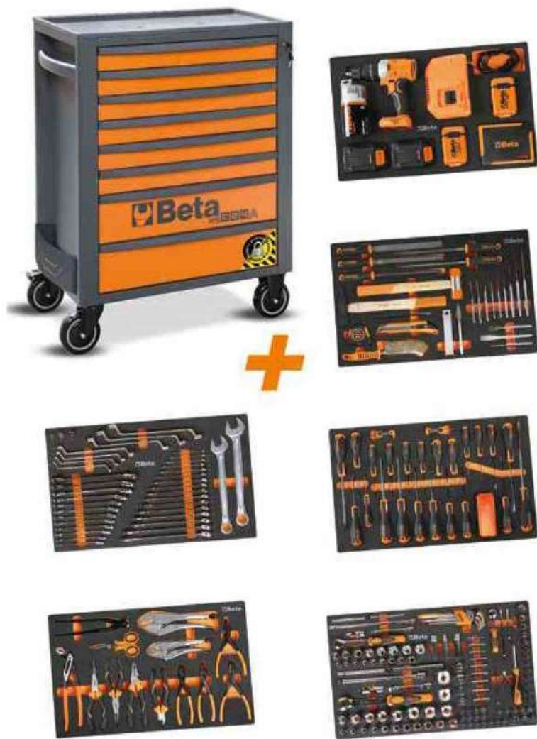
Beta Utensili - Con la nuova proposta commerciale, è stato creato l'assortimento Beta più ricco di sempre con ben 411 utensili per il mondo industria, disposti in 6 termoformati morbidi e perfettamente ordinati negli 8 cassetti della cassettera antiribaltamento RSC24A/8: tra questi, spicca il primo e unico vassoio con il nuovo trapano avvitatore 20V.